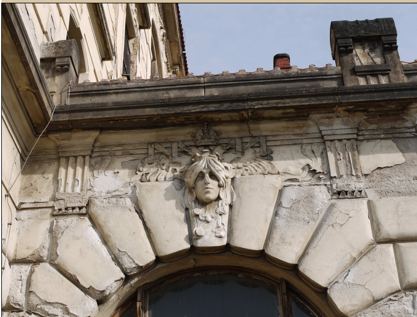
maskaron v klenáku okna stav v roce 2017