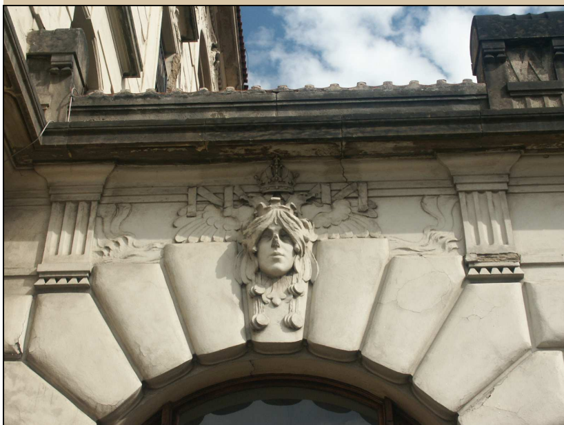
maskaron v klenáku okna stav v roce 2004